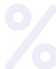
Tableau récapitulatif des différentes possibilités