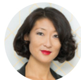
Fleur Pellerin Ancienne ministre, fondatrice et CEO de Korelya Capital.