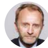
Arnaud Bourdelle Associé