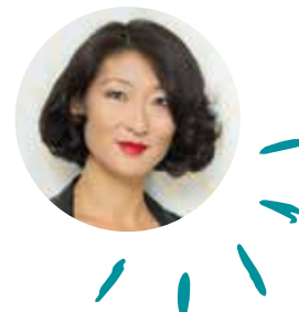
Fleur Pellerin Présidente du comité de mission.

→ 0 nouveau financement de projets dans le pétrole et le gaz depuis octobre 2021